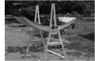
Figura 2. Prototipo de CCP.